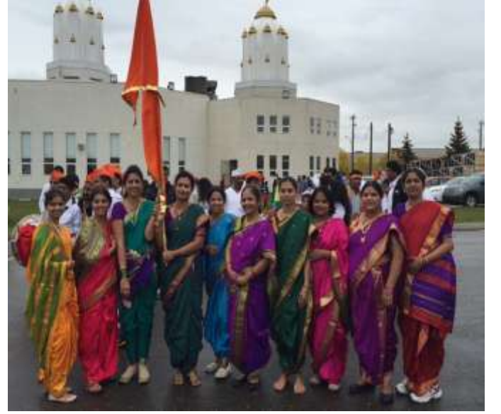
बाप्पा पुढल्या वर्षी लवकर या, घेतो तुमचा निरोप

यंदाचा गणेशोत्सव "ओम गण गणपतये नमः" च्या मंत्रात , आथर्व शीर्ष च्या आवर्तणात , आरतीच्या टाळ्यात, लेझीम-ढोल च्या तालात, पारंपारिक वेशात आणि मराठी अमराठी आणि सर्व धर्मियांच्या उपस्थितीत अतिशय उत्साहाने आणि मोठ्या संख्येने वाजत गाजत पार पाडला . या सर्वांचं श्रेय मराठी मंडळाचे व्यवस्थापक आणि स्वयंसेवक यांना तसच भारतीय कल्चरल सोसायटी ला जातं. सर्वांचे मनःपूर्वक आभार .