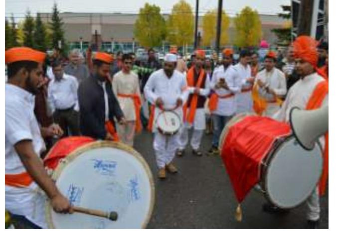
गणपती बाप्पा च्या गर्जेत, दिंडी पताक्याच्या रंगात