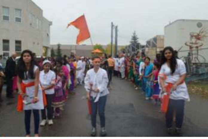
ऊन, थंडी वा पावसात, नाचू लेझीम ढोल च्या तालात