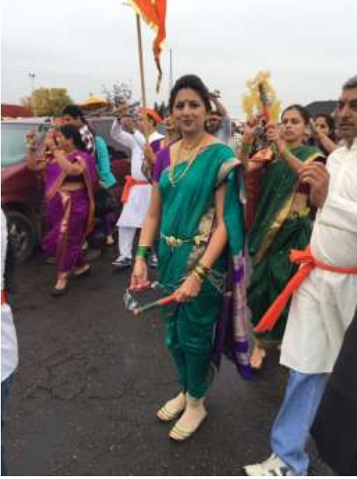
नऊवारी साजरी, नथ नाकात झोकात